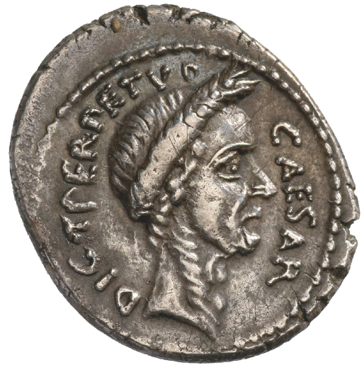
Abbildung 3: Dieser Denar wurde wenige Tage vor Gaius Julius Cäsars Ermordung (um 44 v. Chr.) geprägt.

Die Quellen sind uneins in der Frage, ob das erste Jahr des Julianischen Kalenders ein Schaltjahr war. Wir sind wegen des Neumondes von JD 1'704'987.6515 überzeugt, dass Caesar mit einem Gemeinjahr begann. Sicher ist, dass nachher das Jahr 42 ein Schaltjahr war und anschliessend jedes dritte, bis und mit dem Jahr 9 v. Chr. Dadurch wurden drei Schalttage zuviel eingefügt, was Kaiser Augustus (23. September 63 v. Chr. bis 19. August 14 n. Chr.) korrigierte, indem er die Jahre 5 und 1 v. Chr. sowie 4 n. Chr. zu Nicht-Schaltjahren erklärte. Der Julianische Kalender galt dann vom 1. März 4 n. Chr. ungestört bis zum 4. Oktober 1582. Man braucht ihn auch rückwärts beliebig extrapolierend für die Datierung in der Vergangenheit. Man spricht also etwa von der