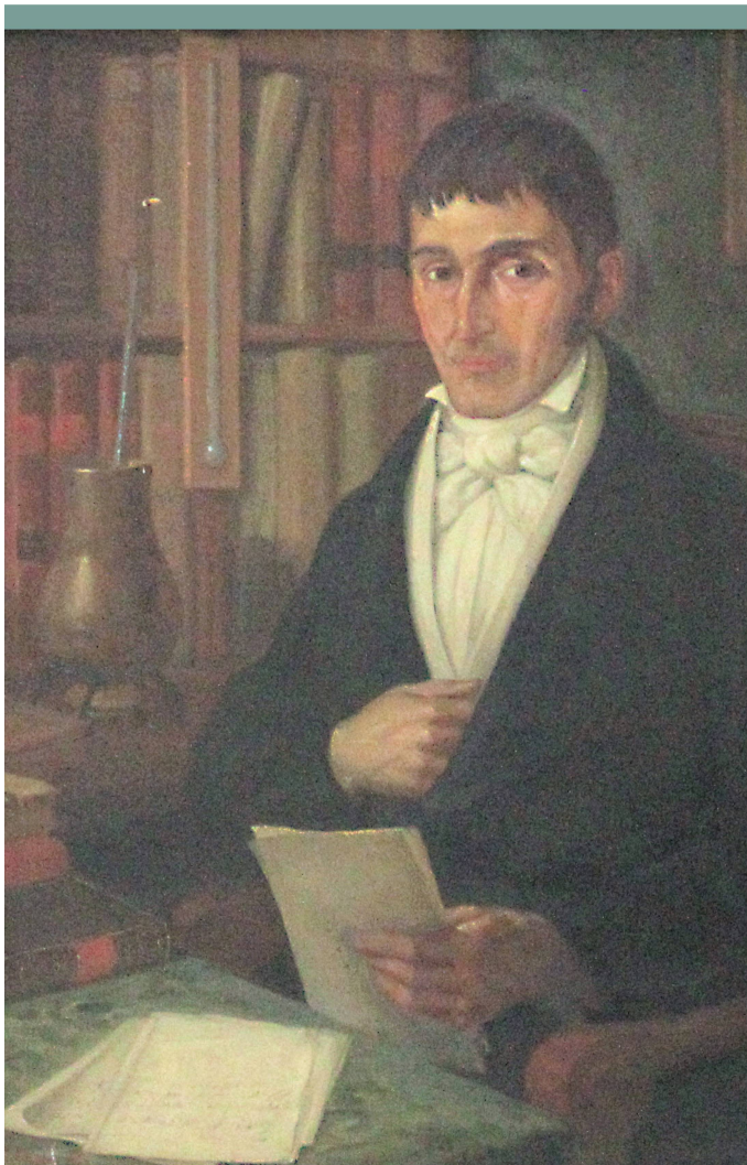
Abbildung 4: Der von Humboldt geförderte Naturwissenschaftler Francisco José de Caldas war einer der ersten Astronomen des Landes und leitete als Gründungsdirektor die Sternwarte von Bogotá (Gemälde im grossen Saal der Sternwarte).