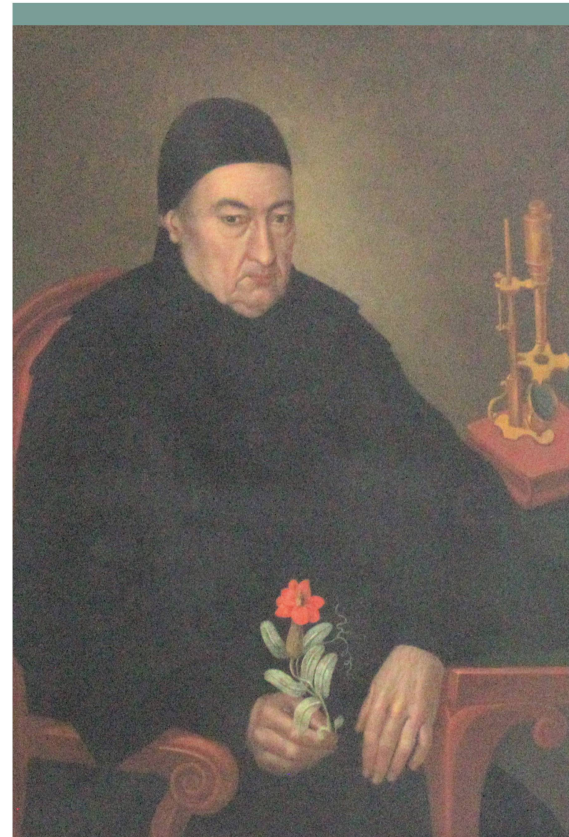
Abbildung 3: José Celestino Mutis , angesehener Naturwissenschaftler und Leiter der Real Expedición Botánica, veranlasste den Bau des kolumbianischen Nationalobservatoriums (Gemälde im grossen Saal der Sternwarte).

Im März 1801 traf Humboldt im Verlauf seiner legendären, mehrere Jahre dauernden Südamerikareise in der kolumbianischen Hafenstadt Cartagena ein und plante, zusammen mit seinem Weggefährten Aimé Bonpland durch Kolumbien auf dem Landweg nach Ecuador zu gelangen. Er berichtete darüber in einem Brief an seinen Bruder Wilhelm : «Der lebhafteste Wunsch, den grossen Botaniker Don Jose Celestino Mutis , der noch ein Freund Linné's ist, und sich jetzt in Santa Fé de Bogota aufhält, zu sehen, und unsre Pflanzensammlung mit der seinigen zu vergleichen,...bewogen mich, den Landweg nach Quito über S[an]ta Fé und Popayan ...dem Seeweg vorzuziehen... Mutis ist ein ehrwürdiger alter Geistlicher, von beinahe 72 Jahren, und dabei ein reicher Mann: der König zahlt für die botanische Expedition, an deren Spitze er steht, jährlich 10000 Piaster. Seit 15 Jahren arbeiten 30 Mahler bei Mutis , und er hat 2 bis 3000 Zeichnungen in gross Folio, welche Miniaturgemälde scheinen.»