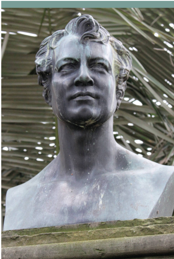
Abbildung 2: Ein Bildnis des jugendlichen Humboldt erinnert im Garten der Sternwarte an den folgenreichen Aufenthalt des Gelehrten in Bogotá. Die Büste wurde dem Nationalobservatorium im Jahr 1969 von der Bundesrepublik Deutschland zu Humboldts 200. Geburtstag gestiftet.