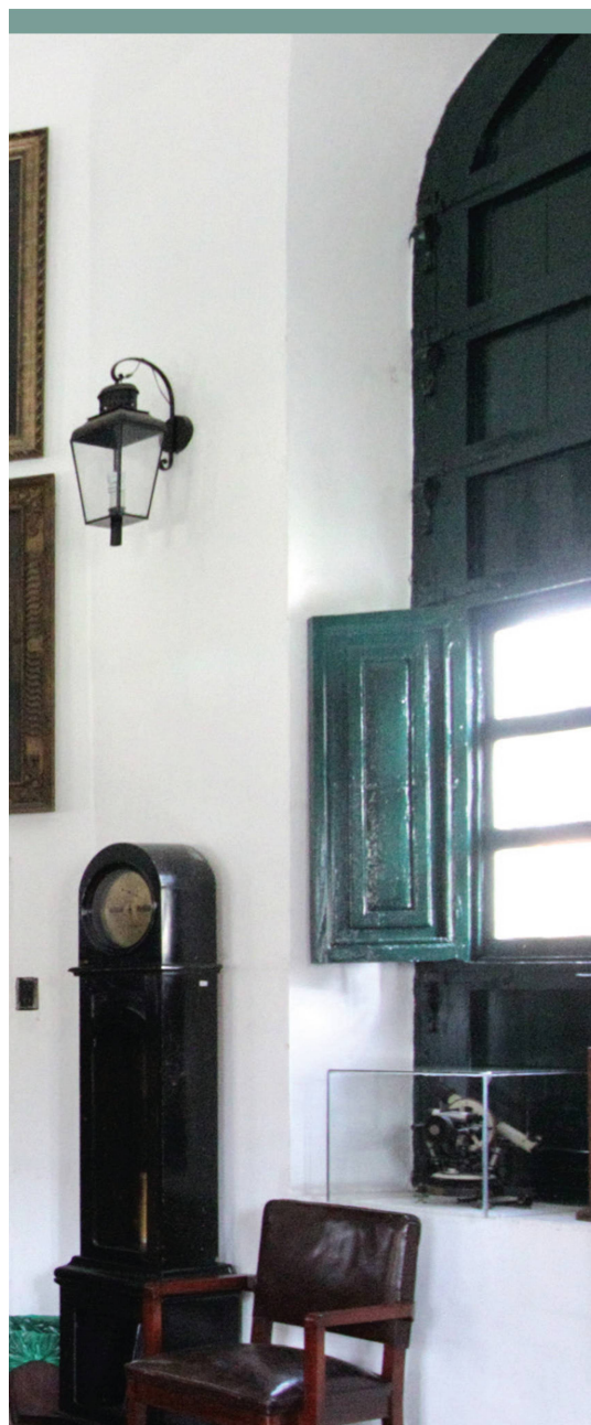
Abbildung 6: Der grosse Saal im ersten Obergeschoss des Sternwartengebäudes erinnert mit seiner Einrichtung an die Zeit, als hier noch die Astronomen ihrer Beschäftigung nachgingen. Jetzt gehört das Observatorium zu den Museen der Universidad Nacional de Colombia. Die Gemälde an der Rückwand des Saals zeigen Persönlichkeiten, die mit der Geschichte der Sternwarte eng verbunden waren, darunter Mutis , Caldas und Humboldt .