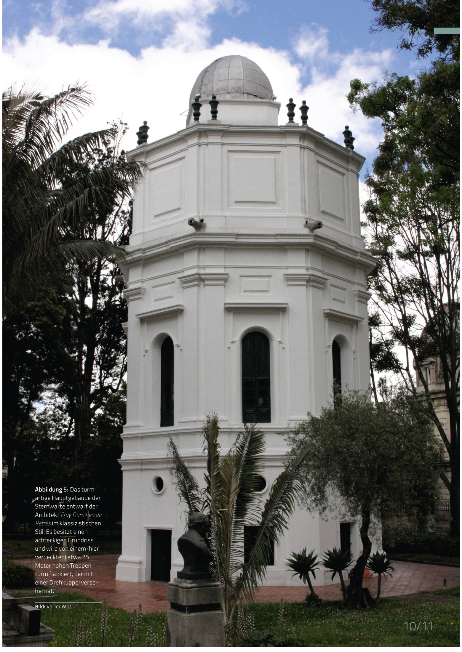
Abbildung 5: Das turm- artige Hauptgebäude der Sternwarte entwarf der Architekt Fray Domingo de Petrés im klassizistischen Stil. Es besitzt einen achteckigen Grundriss und wird von einem (hier verdeckten) etwa 25 Meter hohen Treppen- turm flankiert, der mit einer Drehkuppel verse- hen ist.