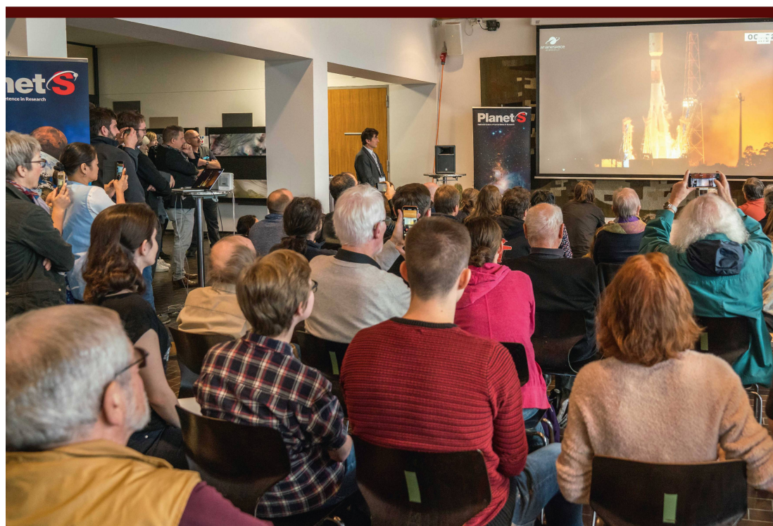
Abbildung 1: Die Zuschauer an der Universität Bern verfolgen den Start von CHEOPS mit Spannung.

Die frühe Orbit-Phase (LEOP) und die Inbetriebnahme im Orbit (IOC) werden von Airbus durchgeführt, bevor das Konsortium der CHEOPS-Mission die Verantwortung für den Betrieb des Weltraumteleskops übernimmt. Anfang Januar beginnt die CHEOPS-Crew mit der Inbetriebnahme des