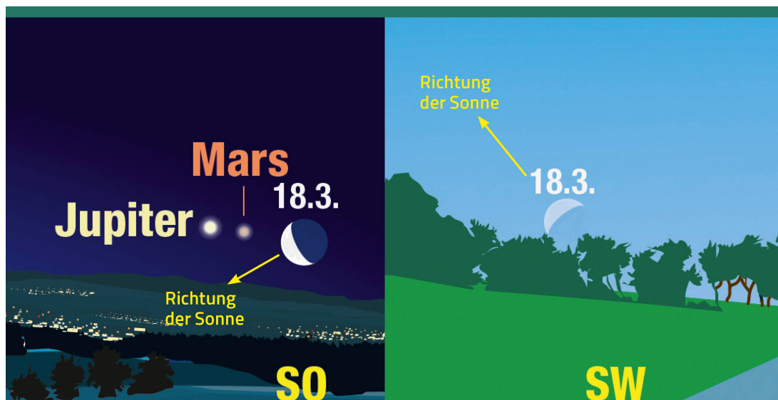
Abbildung 2: Mondauf- und Monduntergang am 18. März 2020. Man beachte die etwas ungewohnte Verkippung der Mondsichel zum Zeitpunkt ihres Untergangs.

entdecken können! Etwas ungewohnt mag uns beim Untergang der Mondsichel deren «Verkippung» sein. Diese kommt jedoch daher, dass die Sonne bei Mondaufgang gewissermassen «unter» dem Mond, bei Monduntergang jedoch «über» dem Mond steht. <