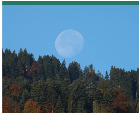
Abbildung 1: Der untergehende abnehmende Dreiviertelmond am Taghimmel.

Es ist in der Tat so, dass wir den zunehmenden Mond eher wahrnehmen als den abnehmenden, da wir weniger frühmorgens aufstehen, um einen Blick an den Sternenhimmel zu werfen. Nach dem Vollmondzeitpunkt verschiebt sich der Mondaufgang in die zweite Nachthälfte hinein. Je nach Steilheit der Ekliptik taucht der Mond täglich eine halbe bis eine Dreiviertelstunde später