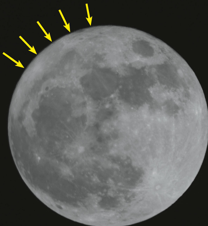
Abbildung 1: Der Vollmond am 19. März 2011 stand 5° südlich der Ekliptik, also fast in maximal möglicher Abweichung. Betrachtet man den Nordrand des Trabanten genau (siehe gelbe Pfeile), erkennt man tatsächlich noch minimale Schattenwürfe entlang des Terminators.

Pension Thomas Breu Fichtenweg 2 D-94256 Drachselsried 0049/9945/905283 www.pension-breu.de info@pension-breu.de