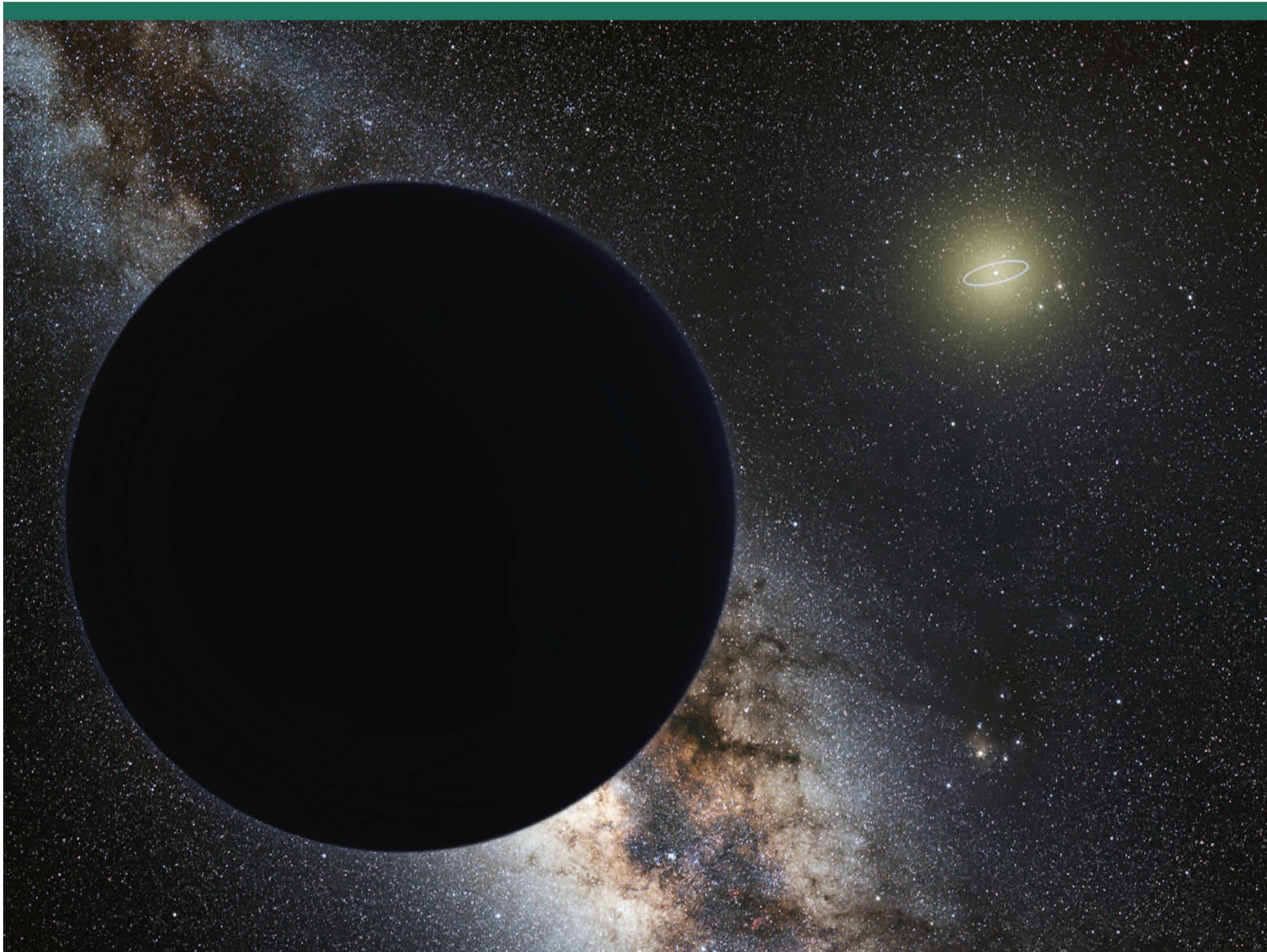
Abbildung 3: Künstlerische Darstellung des Planeten X. Wir sehen um die Sonne die Umlaufbahn von Neptun.