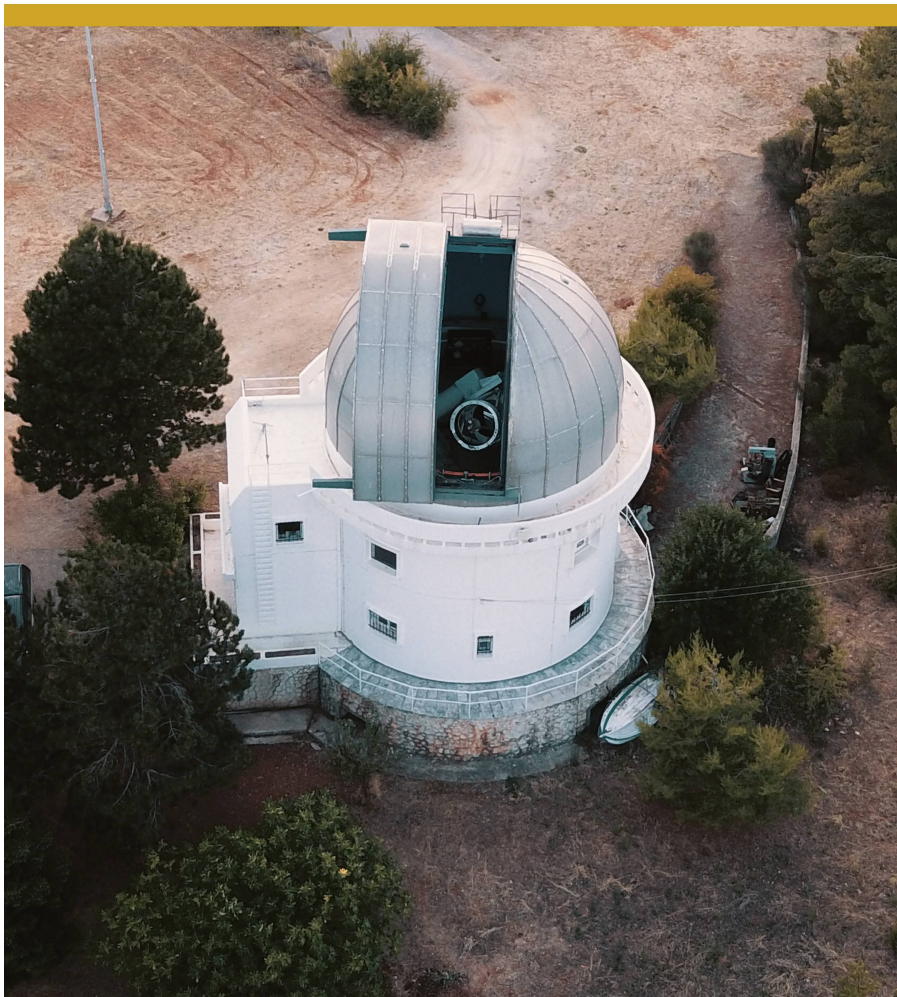
Abbildung 1: Im Norden der griechischen Halbinsel Peloponnes widmen sich die Astronomen des Nationalobservatoriums von Athen seit fast einem halben Jahrhundert der professionellen Himmelsbeobachtung. Die Sternwarte liegt bei der kleinen Ortschaft Kryoneri in 930 Metern Seehöhe und ist in eine rustikale, von Weinbergen geprägte Landschaft eingebettet.

Zu den TLPs zählen aber auch die Mondblitze, extrem kurzzeitige Leuchterscheinungen, die beim Einschlag von Meteoroiden oder anderen erdnahen Kleinkörpern auf der Mondoberfläche entstehen. Da der Erdtrabant keine Atmosphäre besitzt, können bereits kleinste Impaktkörper von wenigen Gramm Masse einen metergrossen Krater erzeugen, wenn sie mit einer Geschwindigkeit von