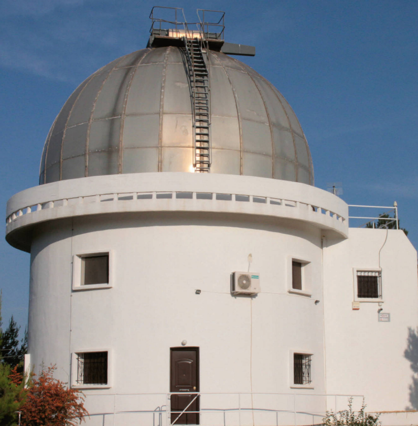
Abbildung 2: Am einsam gelegenen Kryoneri-Observatorium ist die komplette Infrastruktur vorhanden, die für anspruchsvolle astronomische Forschung benötigt wird. In letzter Zeit haben sich die Astronomen dort auf die Beobachtung von Mondblitzen spezialisiert, die beim Einschlag von Meteoroiden entstehen.

Das Observatoriumsgebäude beherbergt unter der domförmigen Kuppel das eigentliche Teleskop, während sich in den unteren Etagen der Kontrollraum, ein Aufenthaltsraum für den Astronomen, Stellplätze für die Datentechnik und die Bedampfanlage für den Teleskopspiegel befinden (Abbildung 2). Das vom britischen Hersteller Grubb Parsons gefertigte 1,2-Meter-Teleskop war ursprünglich als Cassegrain-Reflektor ausgeführt und stellte bis zum Jahr 2008 das Hauptinstrument des NOA dar. Es wurde im Jahr 2016 für die Durchführung des NELIOTA-Programms umgebaut, sodass nunmehr die Beobachtungen ausschliesslich im Primärfokus