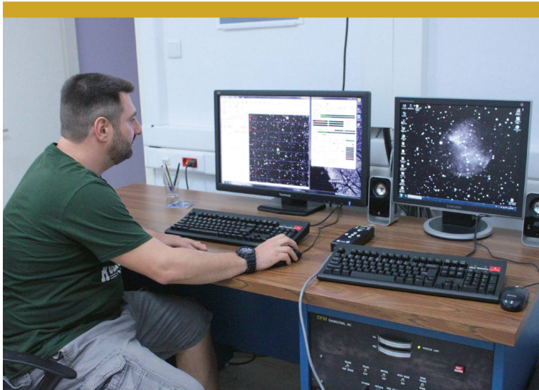
Abbildung 6: Der Astronom Alexios Liakos vom Nationalobservatorium Athen kümmert sich hier von einem separaten Kontrollraum aus gerade um die Teleskopsteuerung. An zwei weiteren Bildschirmen werden die Daten der beiden Kameras angezeigt.