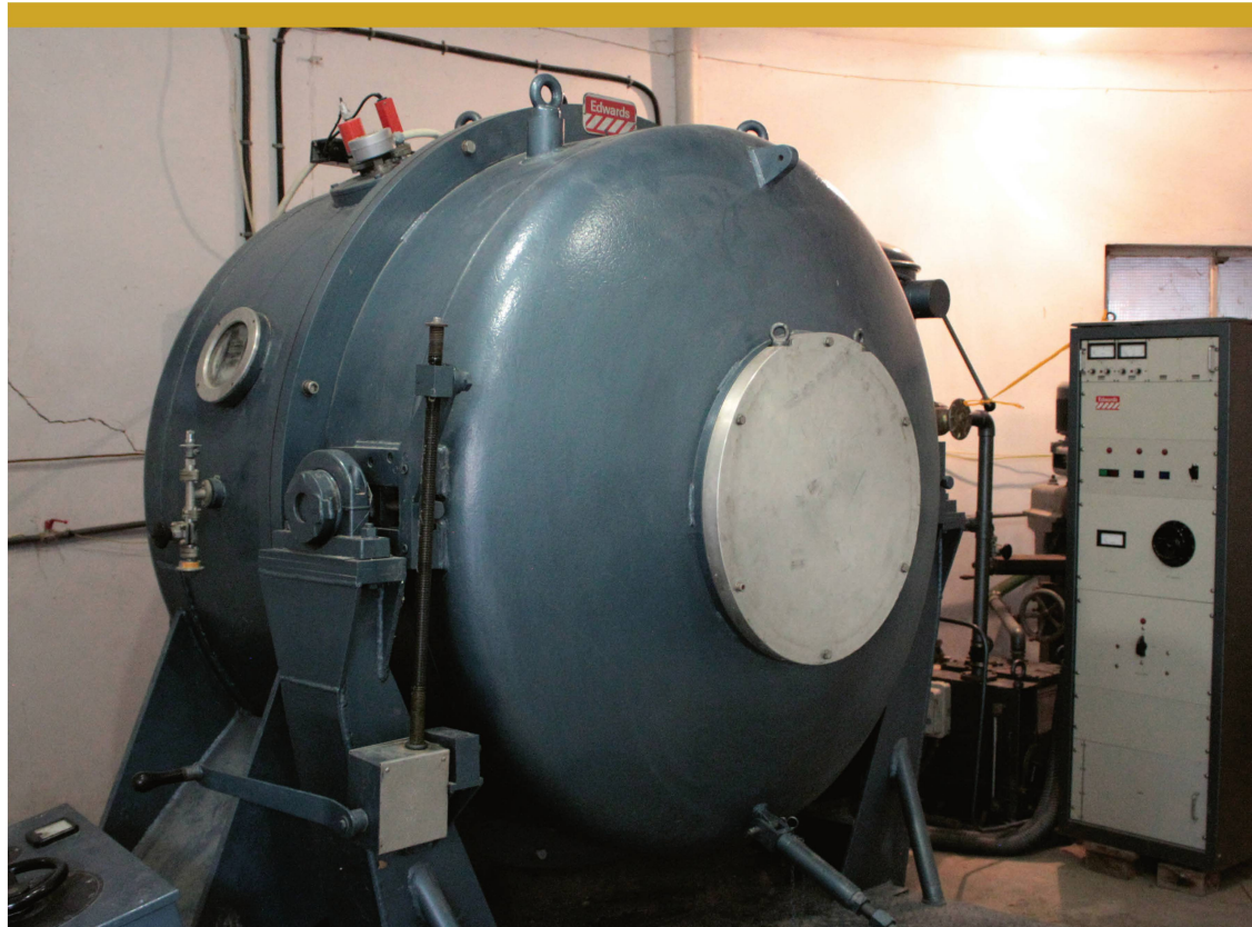
Abbildung 4: Der aus der Glaskeramik Zerodur bestehende 1.2-Meter-Spiegel wird in regelmäßigen Zeitabständen in der hauseigenen Bedampfungsanlage mit einer frischen Aluminiumschicht belegt.