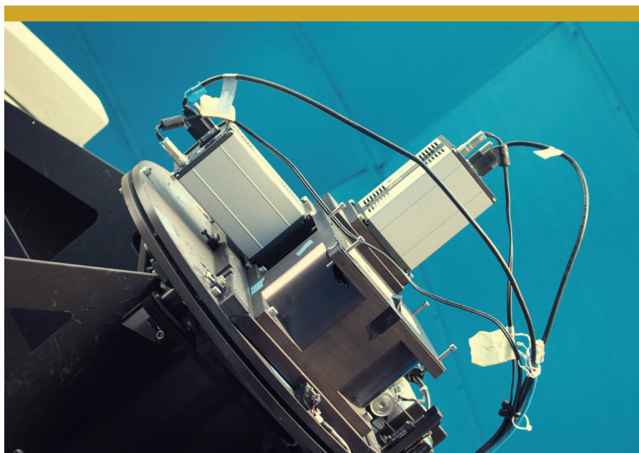
Abbildung 5: Zwei moderne, hochempfindliche sCMOS-Kameras sind im Primärfokus des Reflektors angebracht und registrieren die Mondbilder synchron bei unterschiedlichen Wellenlängen, nämlich im R- und I-Band. Da das vom Hauptspiegel kommende Licht über einen dichroitischen Strahlteiler an die beiden Kameras weitergeleitet wird, sind diese zueinander rechtwinklig angeordnet.

Die Auswertung der so gewonnenen Mondbilder erledigt eine speziell für das NELIOTA-Projekt erstellte Software, die eine automatische Reduktion der Daten vornimmt und selbstständig nach