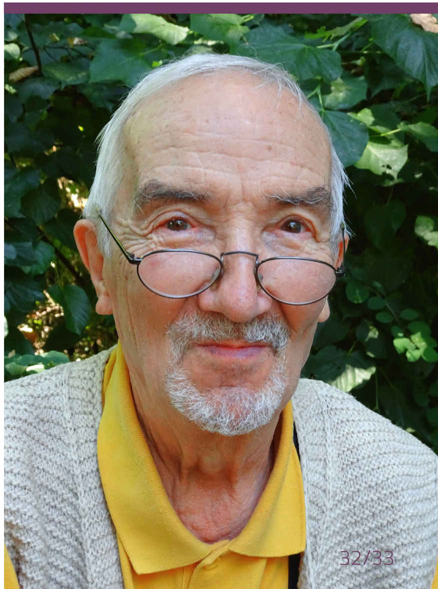
Abbildung 1: Freimut Börngen zählt zu den erfolgreichsten Asteroiden-Entdeckern im deutschen Sprachraum.

ausrichten konnte. Er arbeitete zwar brav die ihm von den Vorgesetzten erteilten Beobachtungsaufträge ab, doch zwischendurch suchte er in ekliptik-nahen Himmelsgegen-