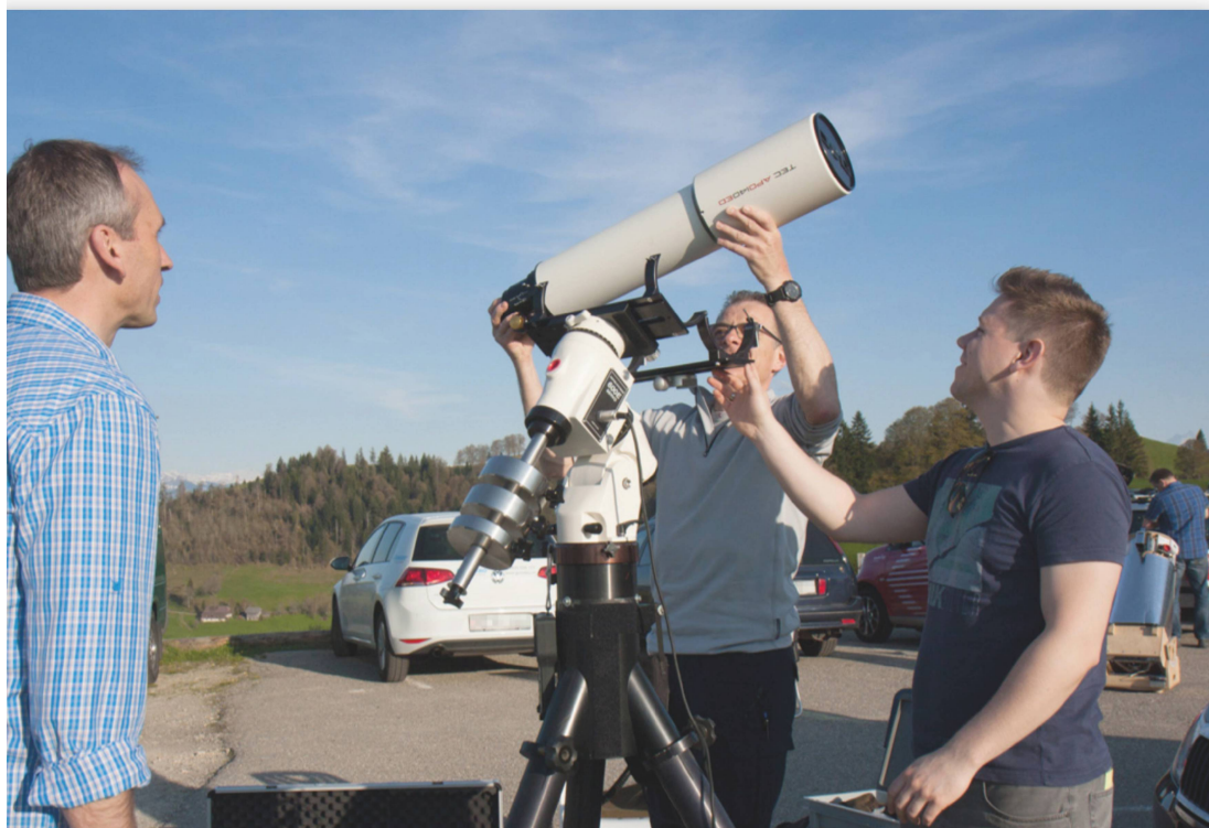
Auf der Ahornalp 2016: Teleskoptreffen bieten hervorragende Gelegenheiten, verschiedene Instrumente vergleichen zu können. Hier wird ein TEC APO 140ED (Refraktor) auf die nachgeführte Montierung fixiert.