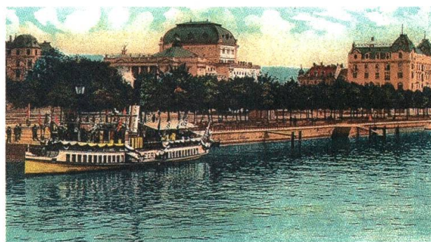
1 Das Utoschloss beim Zürcher Stadttheater um 1910, Kolorierte Postkarte. Baugeschichtliches Archiv der Stadt Zürich

Etwa zeitgleich zum Aufstieg der Maison Moos aufgrund des blühenden Handels mit Hodlers Werken in Genf traten auch die Bollags als Mäzene auf, indem sie