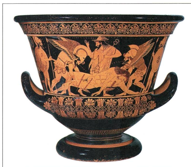
1 Euphronios et Euxithéos, Cratère d'Euphronios , environ 515 av. J.-Ch., cratère à figures rouges, H: 45,8; diamètre: 55,15 cm. Restitué à l'Etat italien

Pour pallier aux litiges éventuels que l'exécution de ces contrats peut susciter, l'ensemble de ces conventions prévoit un arbitrage CCI à Paris avec trois arbitres. Ici aussi la clause est intéressante: malgré l'absence de lien direct de ces accords avec le commerce international, les accords n'hésitent pourtant pas à faire appel à un centre spécialisé dans la résolution de litiges 18 .