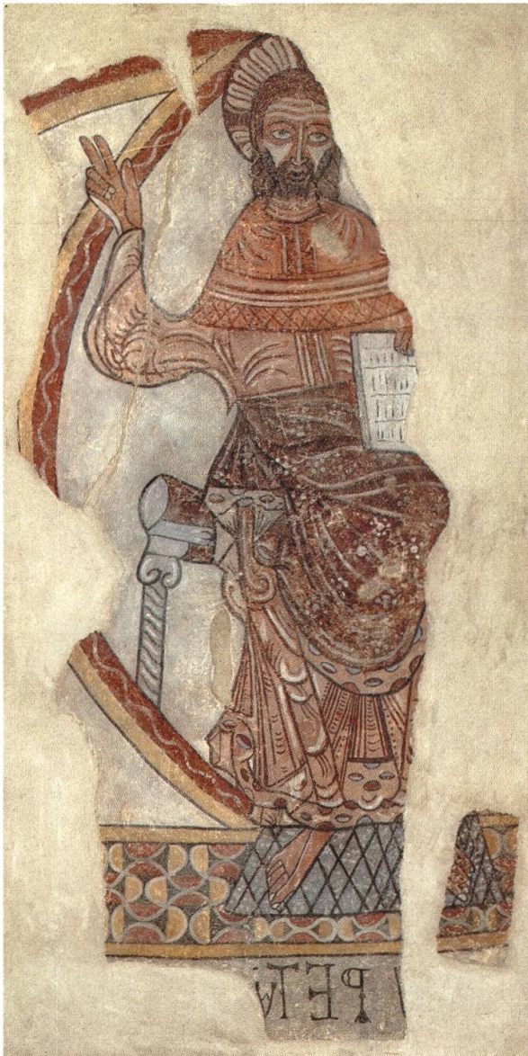
4 Christ en Majesté, fragment des fresques romanes de la chapelle de Casenoves, Roussillon. Restitué par le Musée d'art et d'histoire, Genève, à l'Etat français. Ille-sur-Têt, Musée des Hospices