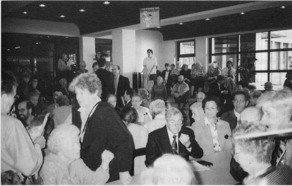
Les conférences le matin ont attiré près de 300 personnes

soudaines, d'insomnies et d'humeur dépressive. Lorsque ces symptômes sont prédominants au début de la maladie, on conseille généralement au patient de consulter un psychiatre.