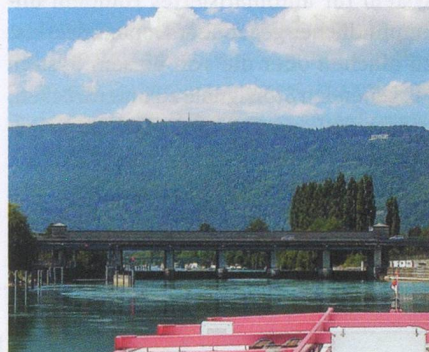
SHG Langnau: Auf der Aare von Altreu nach Biel gereist und dabei auch die Schiffsschleuse in Port überwunden.