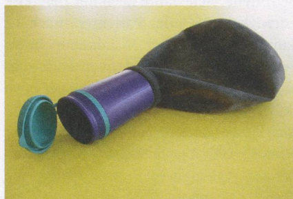
Uribag «Herren»: Robust und praktisch.