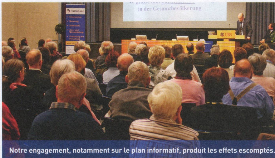
Notre engagement, notamment sur le plan informatif, produit les effets escomptés.

BLA Affaires sanitaires, Administration des hôtes CAH, Worbentalstrasse 36, 3063 Ittigen. jro