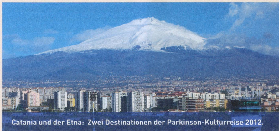
Catania und der Etna: Zwei Destinationen der Parkinson-Kulturreise 2012.