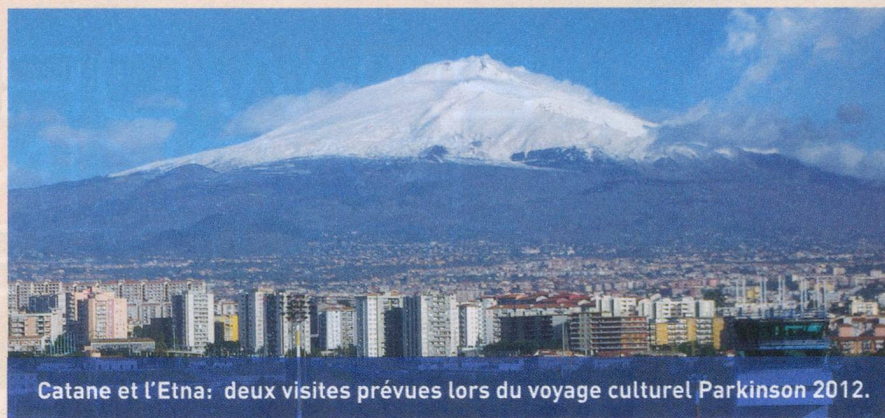
Catane et l'Etna: deux visites prévues lors du voyage culturel Parkinson 2012.