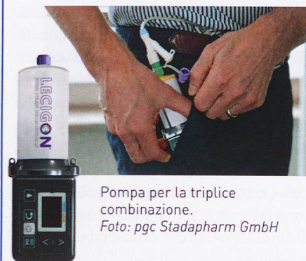
Pompa per la triplice combinazione. Foto: pgc Stadapharm GmbH

Fonte: comunicato stampa di stada.de del 2 febbraio 2021.