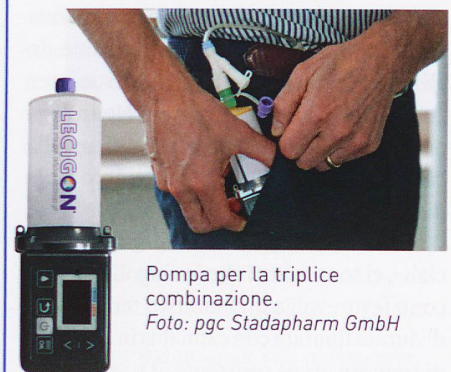
Pompa per la triplice combinazione. Foto: pgc Stadapharm GmbH

Fonte: comunicato stampa di stada.de del 2 febbraio 2021.