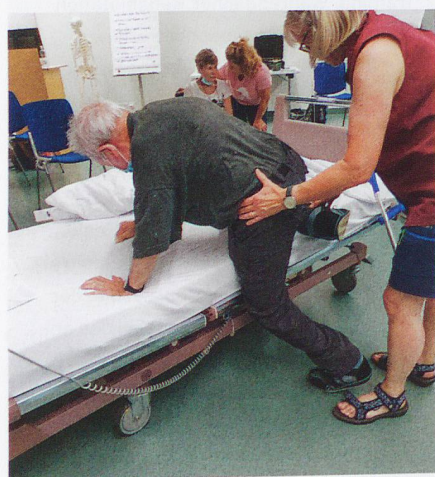
Im Vierfüsslerstand ins Bett steigen.

Während zweier Tage war im Rehaszentrum Valens Kinästhetik angesagt.