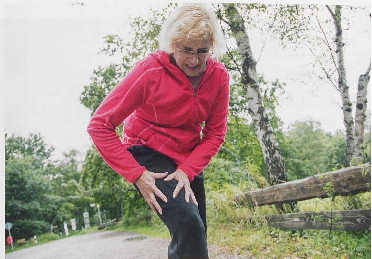
Im Verlaufe der Parkinsonerkrankung leiden bis zu 80% der Betroffenen unter Schmerzen.