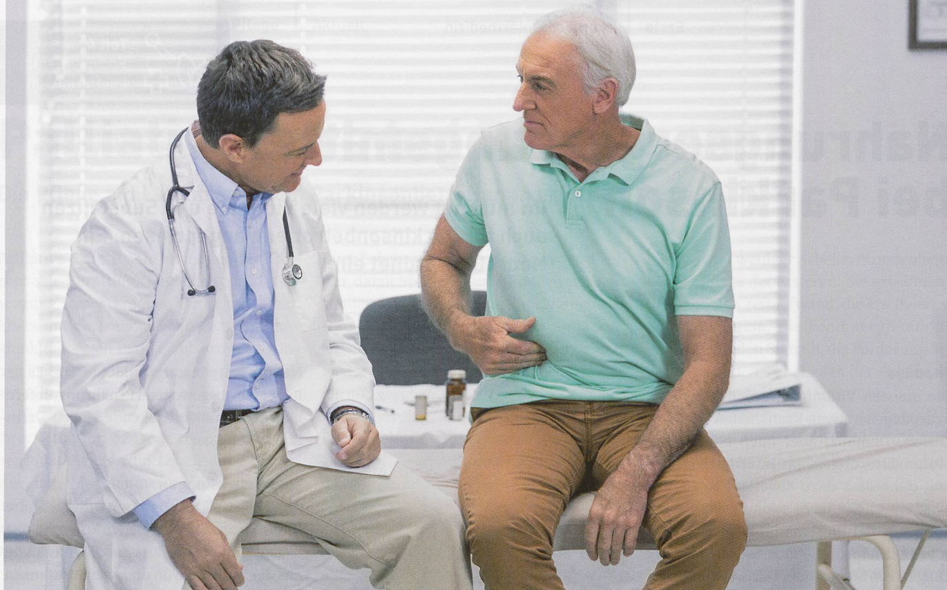
Parkinson-bedingte von nicht Parkinson-bedingten Schmerzen sicher abzugrenzen, ist oft nicht einfach.