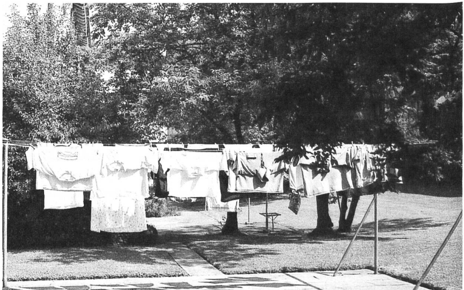
«Siedlungshygiene in Schwamendingen 2»