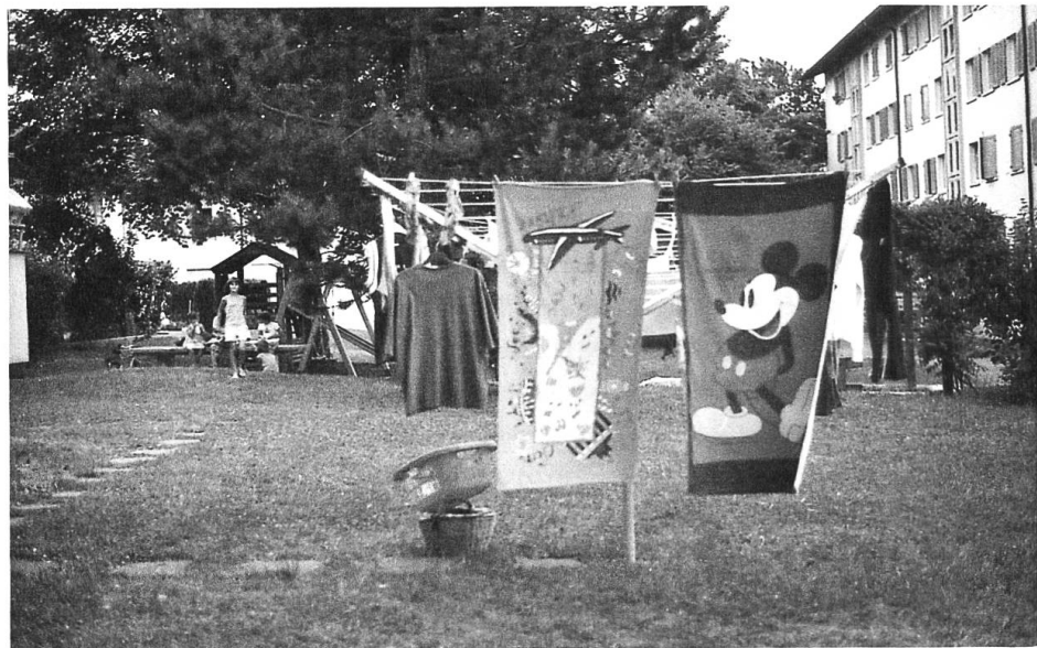
«Siedlungshygiene in Schwamendingen 3»