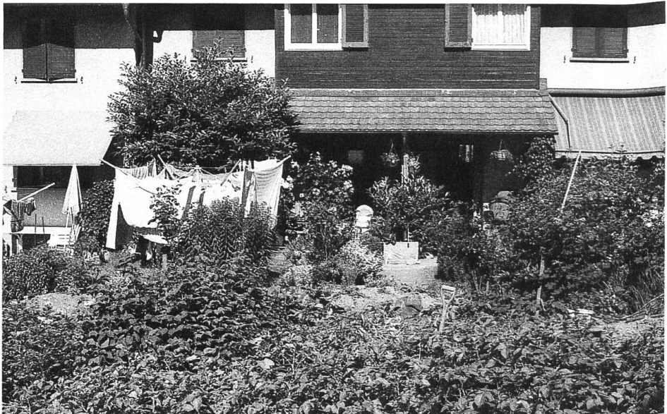
«Siedlungshygiene in Schwamendingen 1»