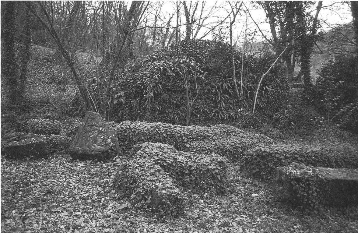
Eingewachsene Fragmente ausserhalb des umzäunten Bereichs

auf die in der zeitgenössischen Diskussion der Renaissance gestellte Frage nach der Abgrenzung von Kunst und Natur schien das Vorgehen viel versprechend: Ist die Landschaft lediglich Träger des Kunstwerks oder ist sie selbst Teil davon? Wo und wie verlaufen die Grenzen?