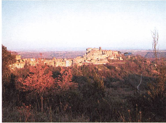
Blick auf die Ortschaft Bomarzo.

In seinen frühen Erwachsenenjahren unterhielt Vicino Orsini zahlreiche Freundschaften zu venezianischen Intellektuellenkreisen. In den Jahren 1542–1543 unternahm er eine mehrmonatige Reise nach Venedig, dem damaligen Zentrum für Dichter, Humanisten, Welterforscher und Kartographen. Nach der Heirat mit Giulia Farnese