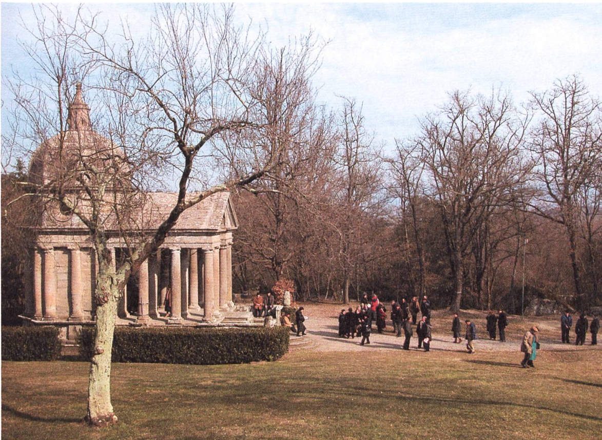
Tempio mit Besuchern aus der Ortschaft Bomarzo an einem Sonntagmorgen im Februar 2003