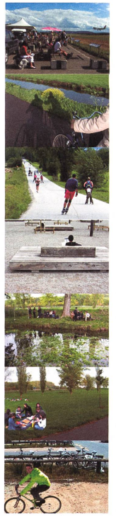
East side: temporary landscape