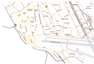
West end: program and traces