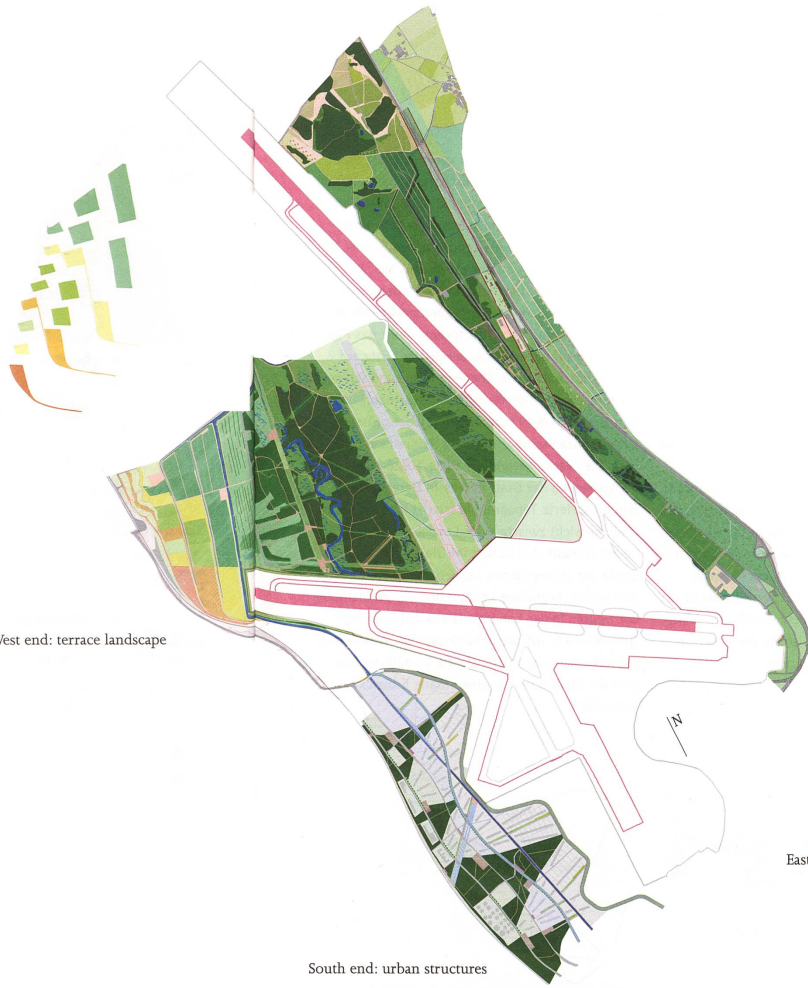
West end: terrace landscape