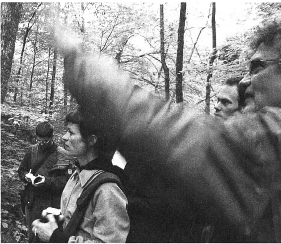
MAS LA Excursion on geology

a depth of about 2.5 kilometres, we would come across gneisses and granites formed about 350 million years ago and belonging to the European continental crust. A process of several hundred million years and a thickness of a couple of kilometres determine the skin of the earth and the human space of action.