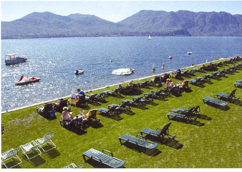
Ansicht des Seeufers im Sommer View of the lakeshore in summer