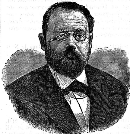
M. Emile Zola.

tentatives de M. Zola et de MM. Labori et Clémenceau, ses conseils, pour engager tout un autre procès. Cela exaspère ces Messieurs, qui à ce jeu serré ne trouvent pas leur compte : ils crient qu'on les empêche de faire la lumière. Demander à la Cour d'assises de casser une sentence d'un conseil de guerre, ce n'est pas faire de la lumière, c'est, en affaire de justice et de droit, faire de l'anarchie.