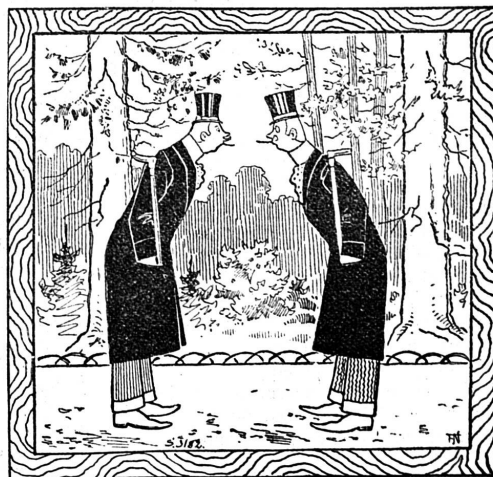
Mais qu'est donc devenu Azor ?