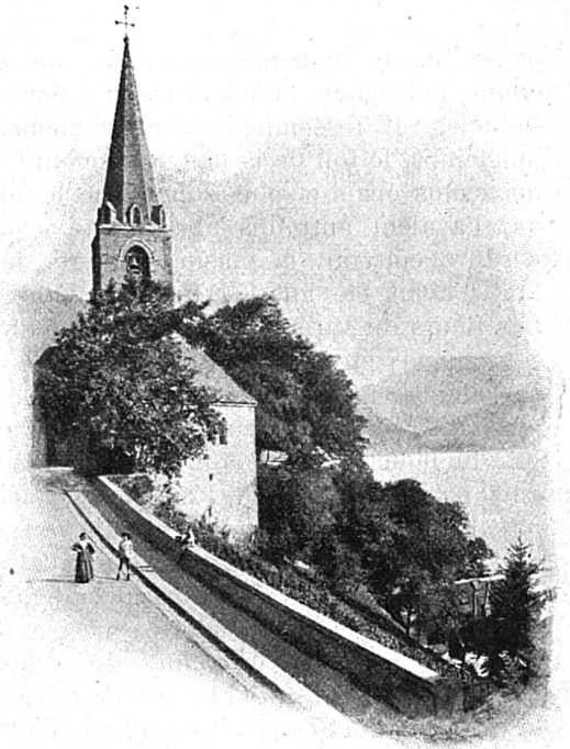
Eglise à Montreux

Eglise à Montreux. — Montreux, que l'on pourrait comparer à Nice par sa position enchantée, a un climat tellement doux que le laurier, le figuier, le grenadier y croissent en pleine terre.