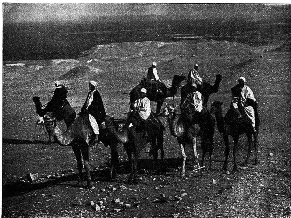
Caravane près de Port-Saïd

ces deux physionomies d'une lumière fulgurante quand leurs regards flamboyants se rencontrèrent, et le même élan spontané, irrésistible, les porta l'un vers l'autre. Aucune langue humaine ne pourrait rendre ce qui se passa dans l'âme de ces deux hommes en cet instant suprême.