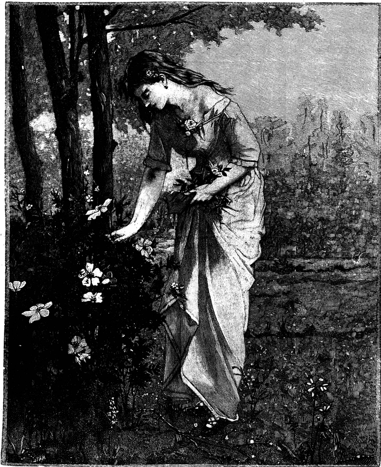
Le Printemps (Tableau de James Bertrand)

dépression de force extraordinaire, put dégager un de ses bras, saisir son poignard et le plonger dans le convulsion, et sa bouche lança un flot de sang et un blasphème. Ses membres se détendirent, puis il fit