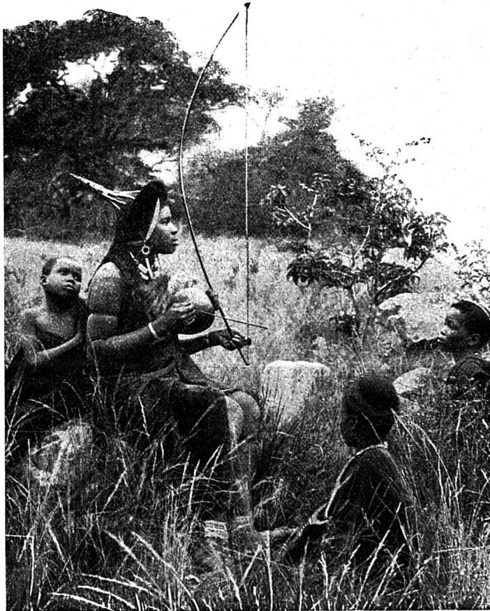
Jeune fille cafre jouant du « rumbu »

jardin de Gethsemane. Situé au nord de la ville, il en est séparé par la vallée aride et sèche du Cédron. On verra d'abord le tombeau de la vierge Marie, dont les restes reposent dans une église souterraine. Dans les niches latérales sont les tombeaux de St-Joseph et de Ste-Anna, mère de la vierge Marie. Dans cette même église on y célèbre de temps en temps le culte grec. Près de là on voit une grotte dans laquelle le Christ pria avant son emprisonnement. Selon une autre version cet endroit se trouverait dans le jardin de Gethsemane. Avant d'entrer dans ce dernier, on vous fait voir l'endroit où Judas trahit son maître par un baiser. Un peu plus loin, un très vieil olivier où Jésus adressa à son père une fervente prière dans un moment d'angoisse et d'abandon. Sur le mont des Oliviers est un petit village arabe avec une chapelle bâtie à l'endroit d'où le Christ s'éleva dans le ciel. De la tour d'une mosquée avoisinante, l'on jouit d'une vue splendide sur Jérusalem et la mer Morte. Tout près est l'église « Pater noster » élevée à l'endroit où Jésus apprit le « Notre père » à ses disciples. Cette prière est écrite en 32 langues différentes dans le couloir autour de la cour.