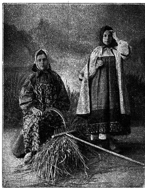
Costumes populaires du sud de la Russie.

brillait une sauvage énergie, on pouvait surprendre les traces d'une joie infernale. Une pensée sinistre, fé-