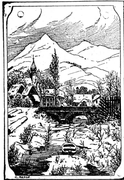
Où est le batelier ?