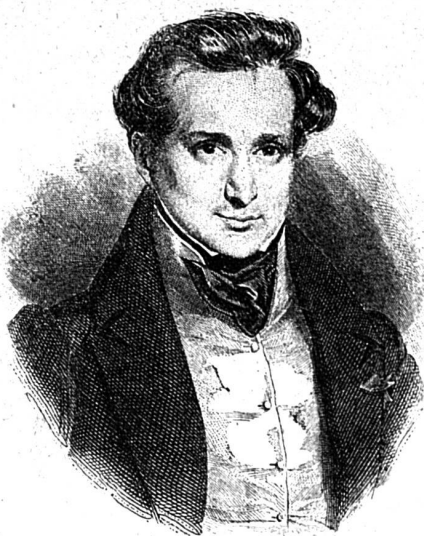
Victor Hugo en 1830