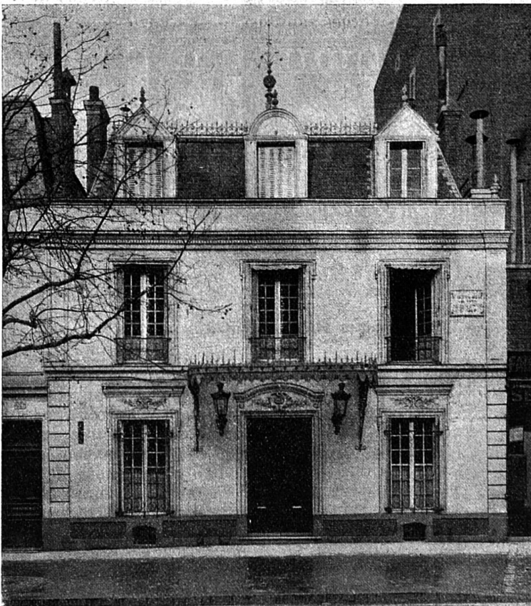
Maison de l'avenue d'Eylau où est mort Victor Hugo le 22 mai 1885