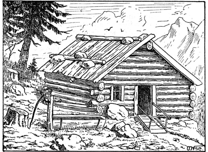
Où est la vachère ?