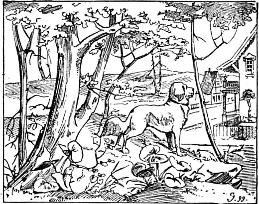
Où est le fils du patron?