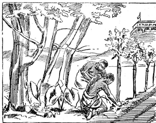
Où est le planteur ?

Cette simple histoire prouve que l'escargot des vignes n'est pas absolument dépourvu d'un sentiment voisin de la ruse; sa façon d'agir dénote en tout cas une part de raisonnement que nous n'avions encore jamais rencontrée chez lui. Nous signalons ce fait à l'attention des zoologistes, dont le rôle est aussi de montrer jusqu'à quel degré un animal, si inférieur soit-il, est capable de penser et de vouloir.