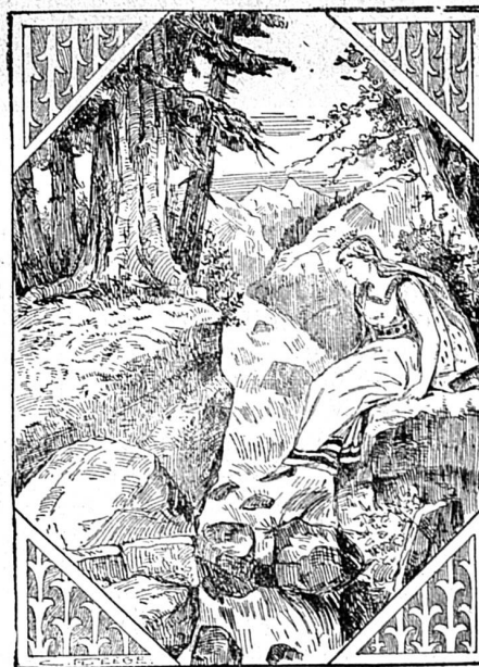
Où est le chevalier?

D'après les statistiques du dernier recensement, les Canadiens-français au Canada sont au nombre de 1.646,402 et les citoyens de nationalité française, de 2,969.