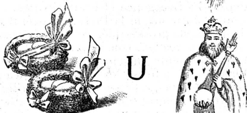
Solution du rébus paru dans le N° 24

Bienheureux les miséricordieux parce qu'ils obtiendront miséricorde.