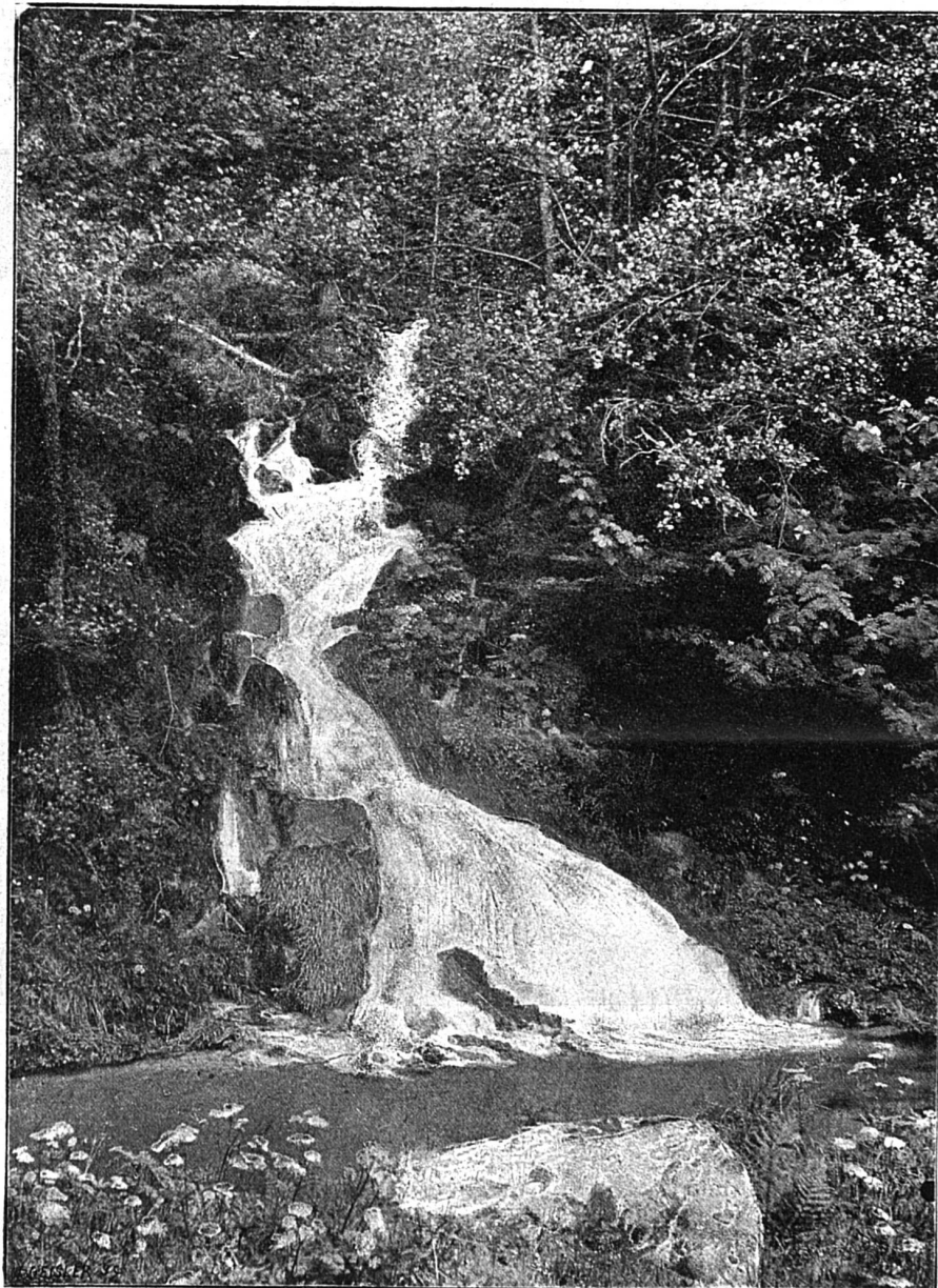
Cascade des Chavons

Dans un charmant bassin de prairies, l'eau coule, actionnant une scierie, apportant la fertilité en des rigoles sans fin, jusqu'à la maison forestière.