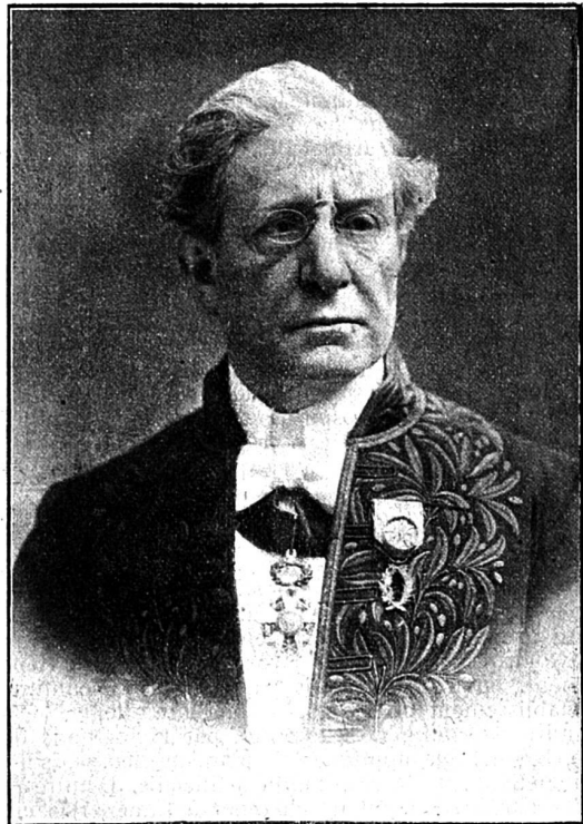
M. Benjamin Constant

Il refusa à son retour la nomination aux fonctions de gouverneur général de l'Indo-Chine qui lui avait été offerte, fut nommé membre du cabinet en 1889, joua un grand rôle dans l'organisa-