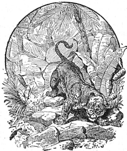
Cherchez le chasseur.

Editeur-Imprimeur: G. Moritz, Gérant de la Société typographique, à Porrentruy.