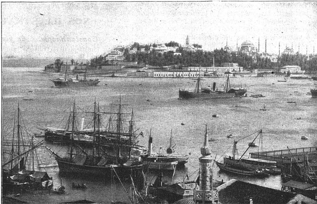
Constantinople : Le vieux sérail, vu de la mer

Au moment de descendre pour le dîner, comme à l'ordinaire, chez mon traiteur, j'ai été pris l'autre jour du désir de manger seul dans ma chambre, près de l'âtre où une bonne déesse avait allumé un feu clair, et avec ce que j'ai trouvé dans les placards, je me suis confectionné un souper qui eût fait envie à des gourmets.