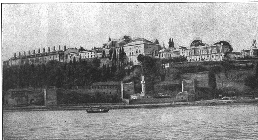
Constantinople : Le vieux sérail, vu du Bosphore