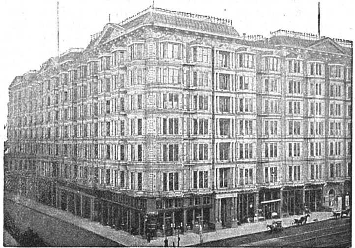
Un hôtel monstre à San-Francisco

geuse, il lui répondit sur le même ton :