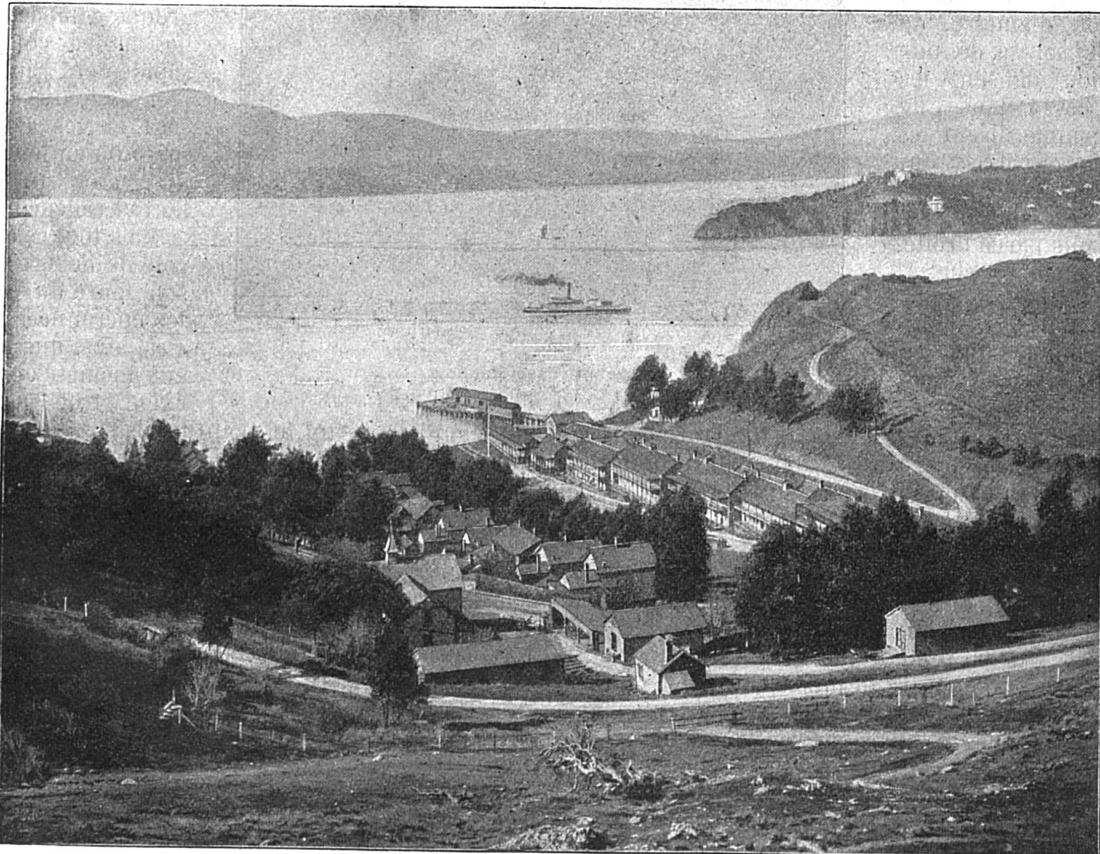
L'île des Anges dans la baie de San-Francisco