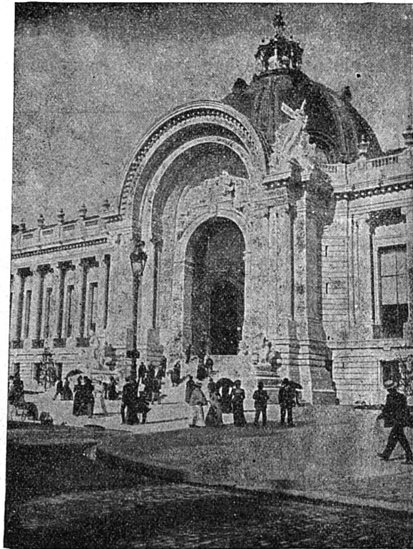
Paris : Façade du Petit Palais.

Et le gardien moustachu, du bout de sa canne, me montre une inscription en grosses lettres au-dessus de la porte : Hôpital Tenon .