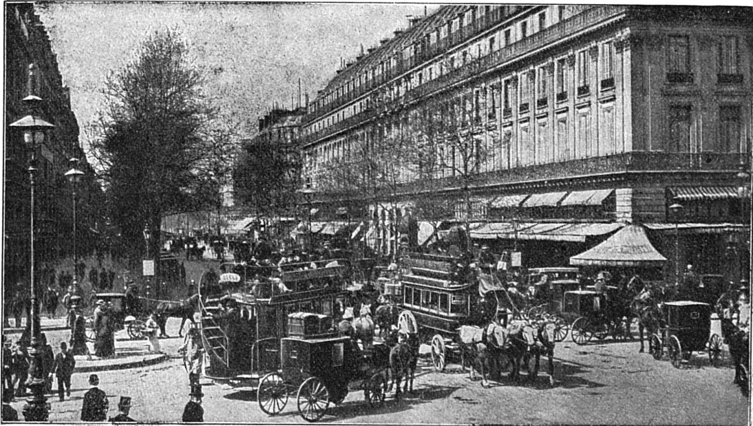
Paris. — Le Boulevard des Capucines.

En vain ai-je cherché un Barignon sur l'almanach