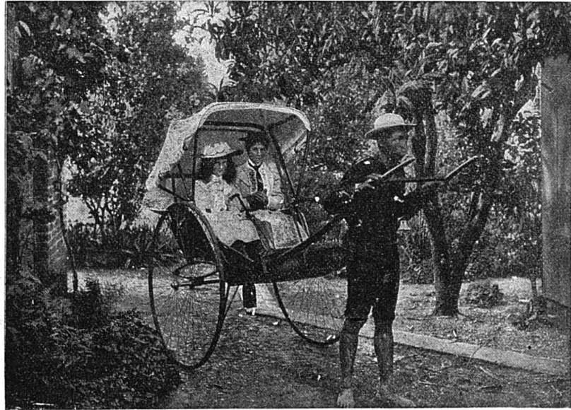
Chariot en usage à Port-Natal (Afrique du Sud).

— Je l'épouse ! s'écrie l'autre tout joyeux... Jeune, riche, belle et sans famille !... Mais alors c'est le chef-d'œuvre