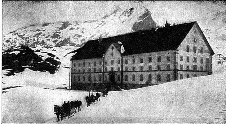
L'hospice du Simplon entre Brigue et Domo-d'Ossola, construit par ordre de Napoléon 1 er

un nouveau débouché sur l'Italie et permettra aux touristes de nouveaux voyages plus agréables et plus rapides. A. L. C.