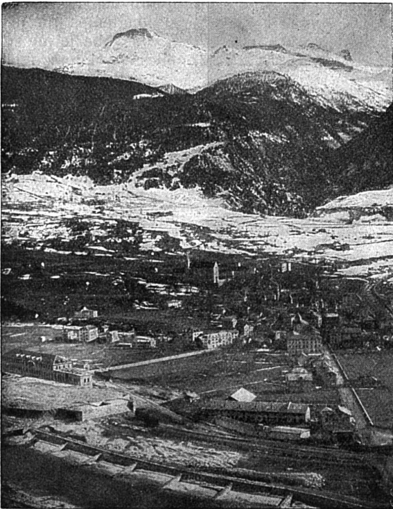
Le village de Brigue

L'on se repent rarement de parler peu, très souvent