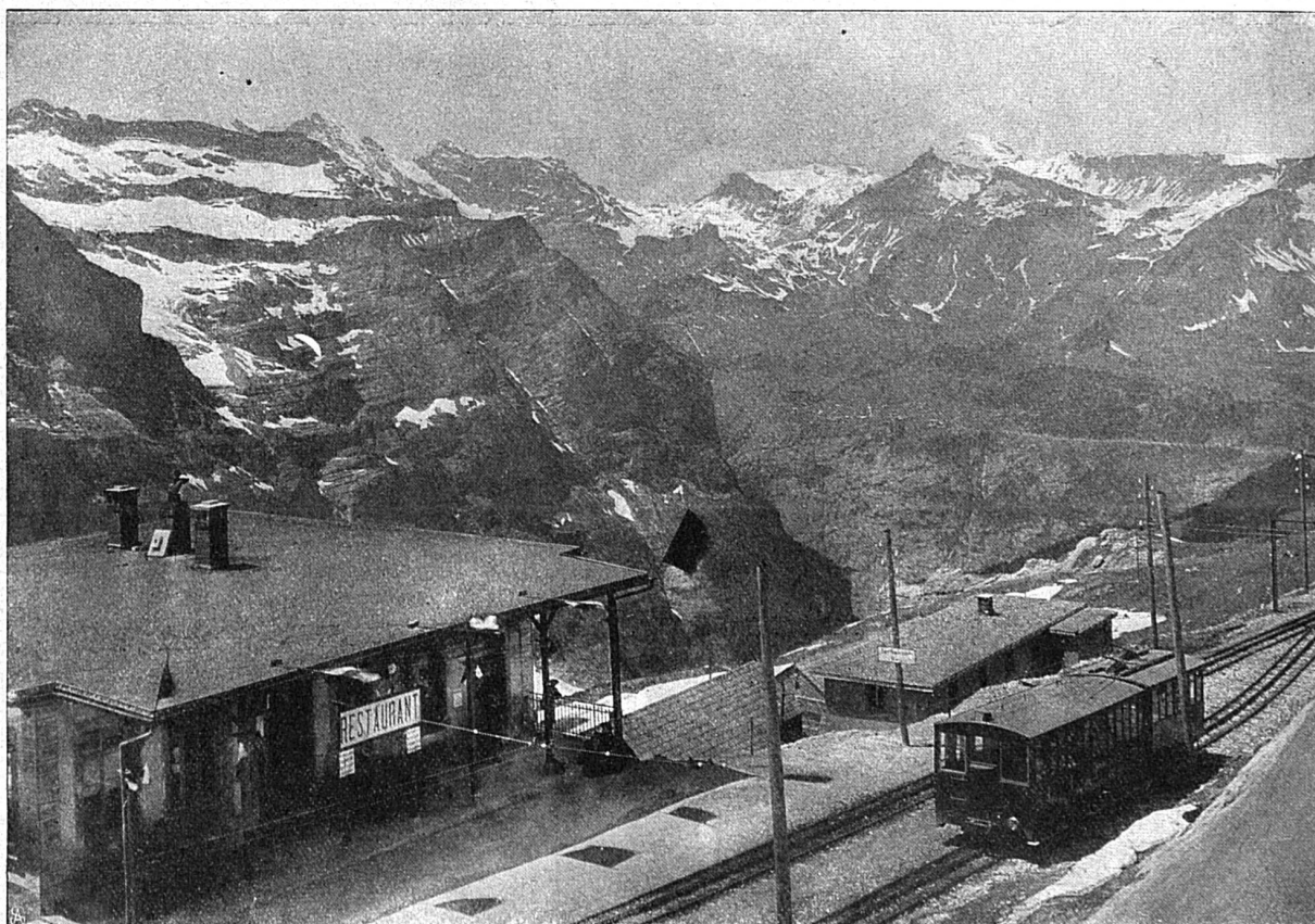
Station Eigergletscher du chemin de fer de la Jungfrau. Vue sur Mürren

Le parcours de toute la ligne du chemin de fer de la Jungfrau est un chef-d'œuvre de technique remarquable, mais quelques points sont cependant à admirer tout spécialement, soit par la splendeur de la vue qu'ils offrent, soit par l'originalité du site.