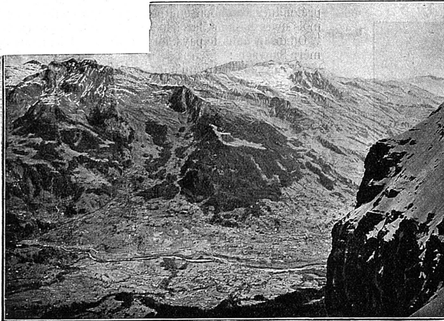
Vue prise du belvédère de la Station d'Eigerwand sur la Vallée de Grindelwald

Tout à coup, je me la rappelai telle que je l'avais vue pour la dernière fois, en 1869, propre, vêtue de vigne, avec des poules devant la porte. Quoi de plus triste qu'une maison