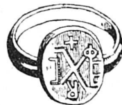
Anneau chrétien du II e siècle

En Etrurie, dès le VI e siècle avant J.-C., les gens du peuple en portaient de bronze ou de fer, les nobles et les chevaliers les avaient d'or massif comme celui représenté par la fig. 2.