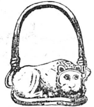
Anneau étrusque (or massif)

Les Egyptiens en avaient de fort beaux, l'un d'eux, de la collection du capitaine Mynes, est formé d'un cercle d'or orné d'une plaque également en or où on lit en caractères hiéroglyphiques : Roi du Nord et du Sud — Amen — Patron de la Maison — Ami du Peuple.