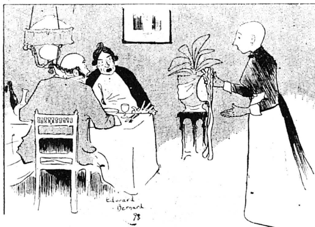
— Oh ! madame peut s'assurer que ce n'est pas des miens...