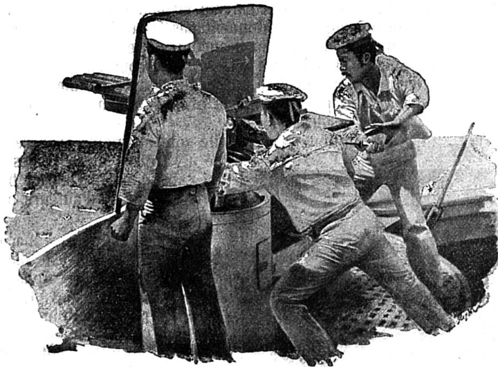
Tir d'une mitrailleuse japonaise pendant le combat