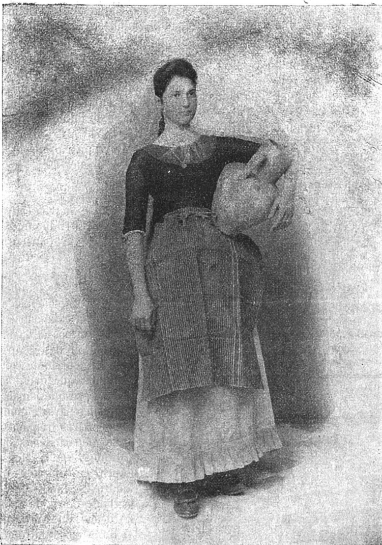
Paysanne de Majorque

Ni les uns, ni les autres ne me manquèrent. Comme le récit complet de mon séjour aux Baléares dépasserait la limite d'un article, je cueillerai simplement dans mon journal les impressions et les récits les plus pittoresques. Ce sera assez pour donner une idée de la vie délicieuse et mouvementée qu'un jeune homme actif peut mener dans un pays où, en l'an 1903, une automobile sur une route provoque autant de signes de croix qu'elle rencontre de paysans.