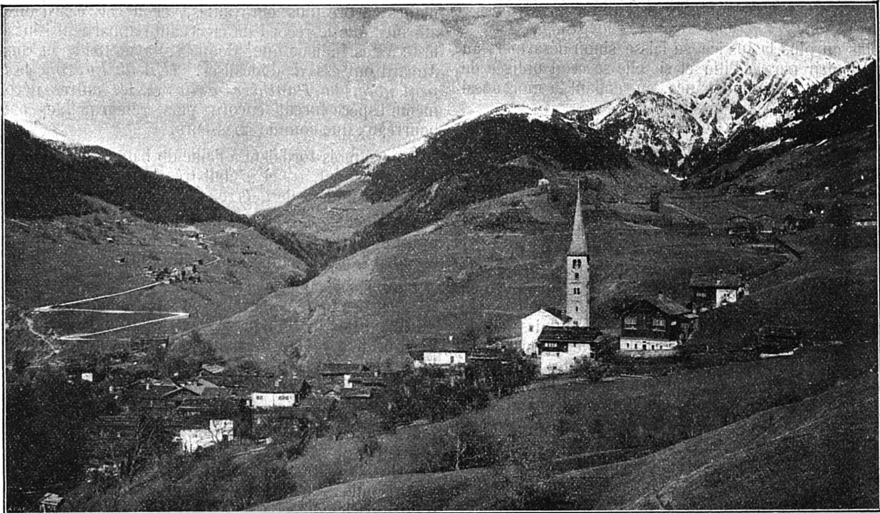
Vue générale du village de Grengiols