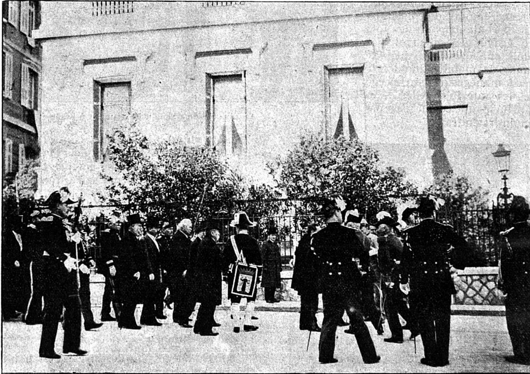
Arrivée de la municipalité de Monaco au palais du gouverneur

revue, passée par le gouverneur général, la poignée de rousiers forme une double haie au milieu de laquelle prennent place les dignitaires et les fonctionnaires de la principauté, y compris les membres du conseil municipal. Fanfare en tête, le cortège gravit les rues du vieux Monaco, rues étroites et tortueuses comme toutes celles des vieilles cités de la côte. Processionnellement, le cortège se rend à l'église, où un office est célébré, puis il redescend dans le même ordre jusqu'au palais du gouverneur, où la disjonction s'opère.